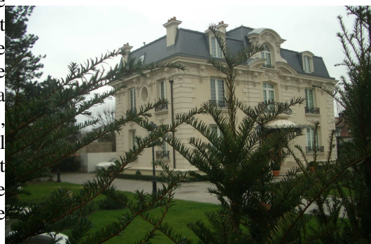
Villa Suzette (Le Vesinet)

De plus, si on se réfère au travail accompli par des citoyens congolais sur les biens mal acquis « des nouveaux riches congolais », on découvre que beaucoup de ses proches possèderaient des propriétés dans la région parisienne. Ainsi, son neveu Wilfrid, qu'il a nommé conseiller politique et qui dirige la société congolaise des transports maritimes (Socotram), posséderait un appartement de 550m 2 avec une belle terrasse de 100m 2 . Le neveu du président congolais aurait aussi un faible pour les voitures de luxe : Porsche, Mercedes, BMW, Jaguar et une Aston Martin DB9 auraient leur place dans les sous-sols de l'immeuble. 358 Le frère du président, PDG d'une compagnie pétrolière Likouala SA, plusieurs fois mise en cause par la justice, posséderait une propriété à Argenteuil. Son neveu, directeur du domaine présidentiel, posséderait un bel appartement dans le 16 ème arrondissement à Paris. La liste est longue et hormis la famille de Sassou-Nguesso, elle révèle de nombreux biens au Congo ou en France, détenus par l'entourage du président congolais et des hauts fonctionnaires congolais.