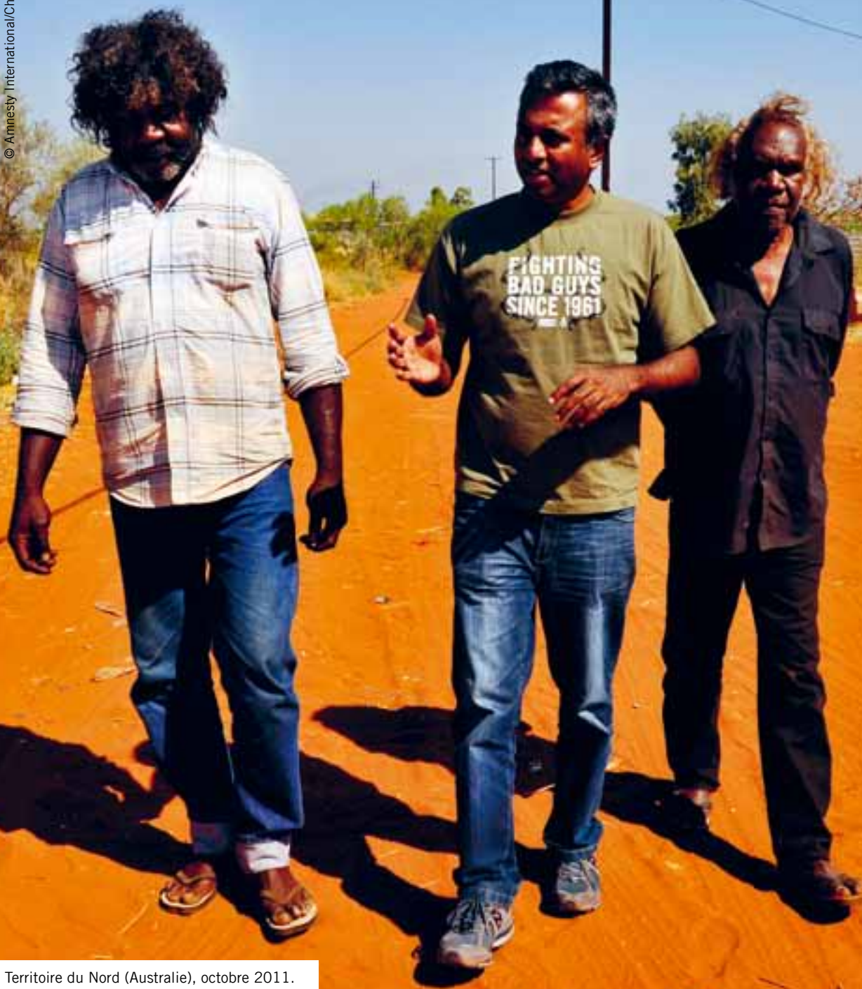
Territoire du Nord (Australie), octobre 2011. Le secrétaire général d'Amnesty International, Salil Shetty (au centre), évoque avec deux représentants du peuple anmatyerr l'insuffisance de services de base pour les communautés aborigènes isolées.