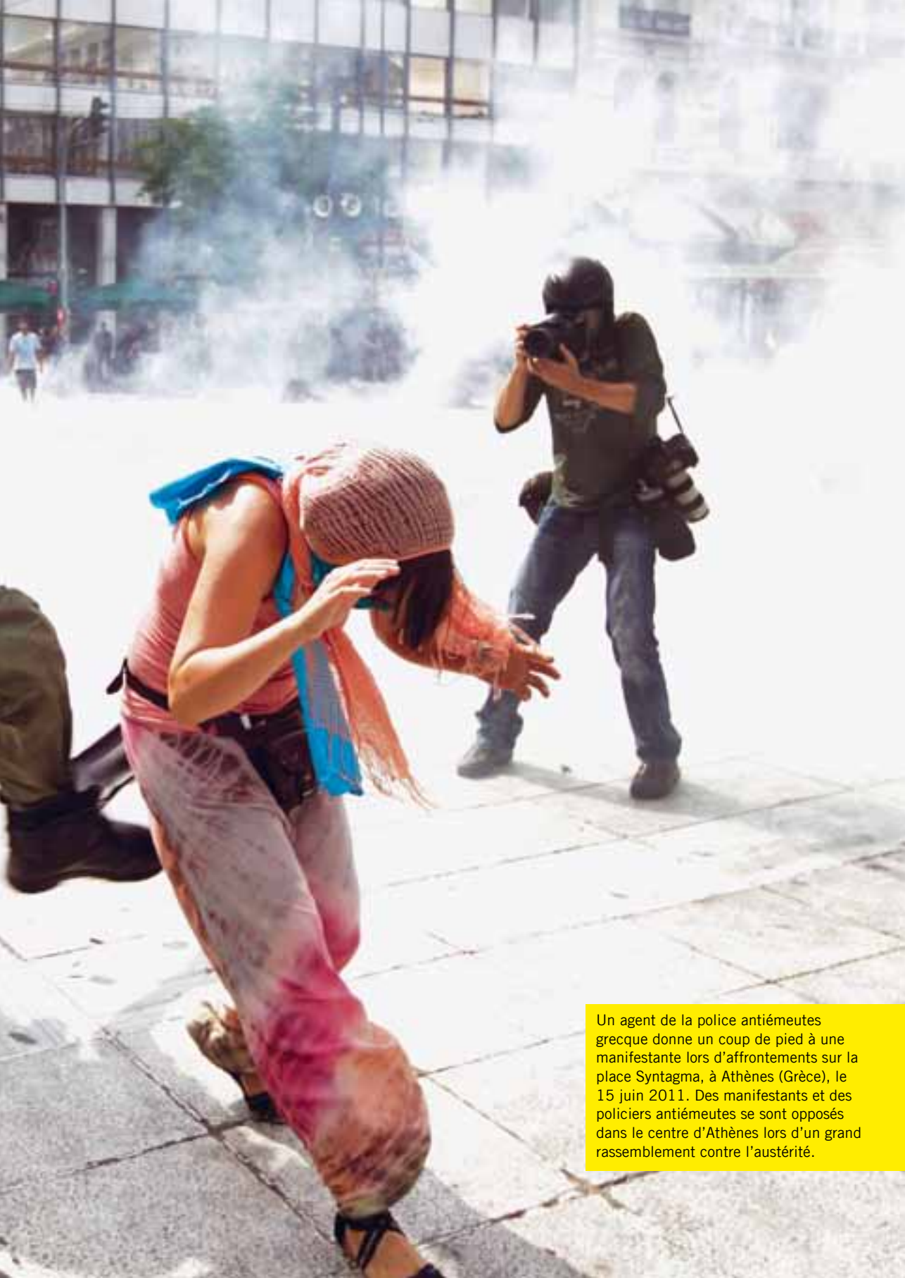
Un agent de la police antiémeutes grecque donne un coup de pied à une manifestante lors d'affrontements sur la place Syntagma, à Athènes (Grèce), le 15 juin 2011. Des manifestants et des policiers antiémeutes se sont opposés dans le centre d'Athènes lors d'un grand rassemblement contre l'austérité.