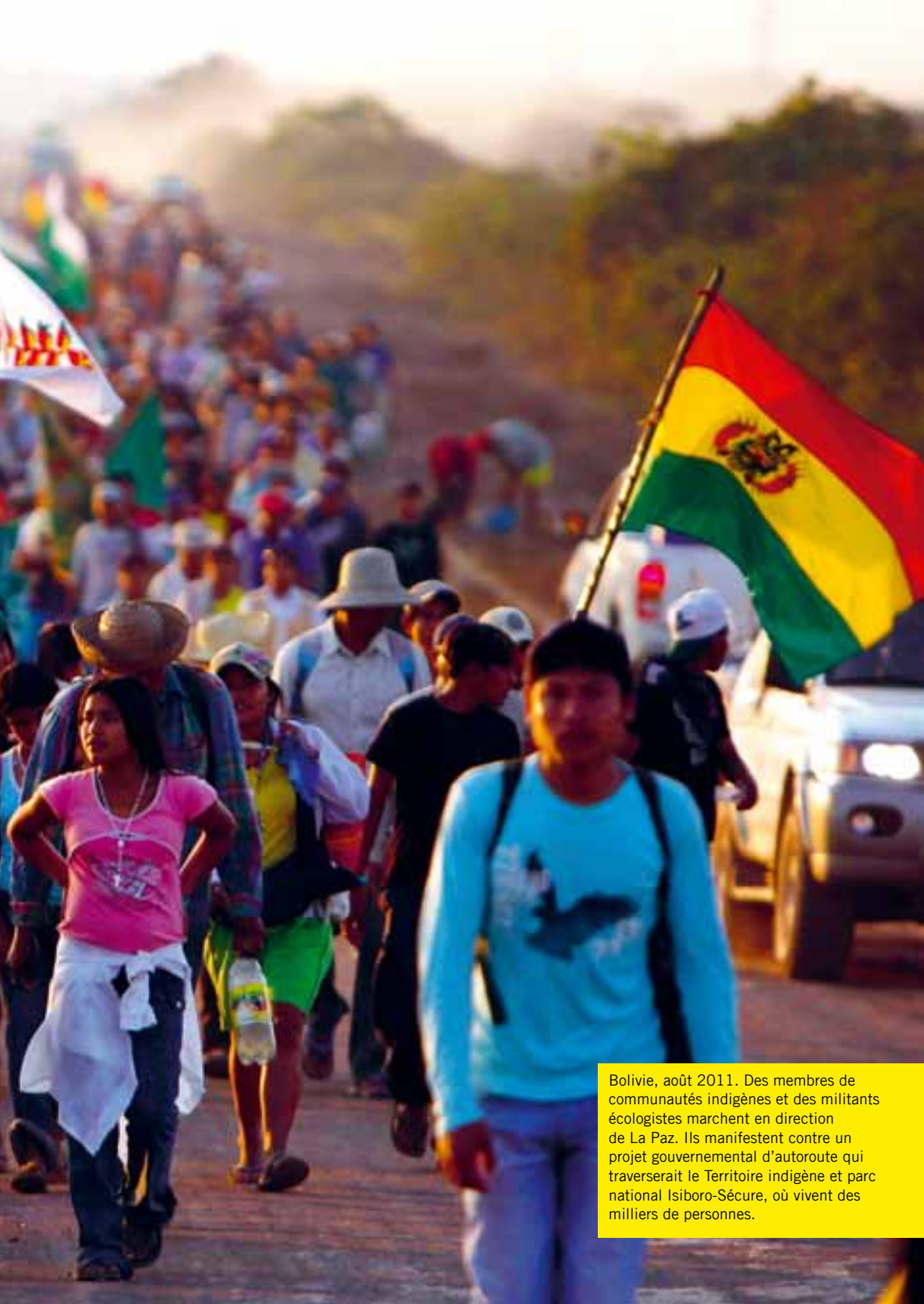
Bolivie, août 2011. Des membres de communautés indigènes et des militants écologistes marchent en direction de La Paz. Ils manifestent contre un projet gouvernemental d'autoroute qui traverserait le Territoire indigène et parc national Isiboro-Sécure, où vivent des milliers de personnes.